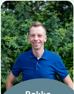
Bokke Klein Zandvoort De Arendsvleugel

‘Een school waar warmte en ambitie hand in hand gaan, geeft mij enorm veel energie’